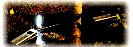
2015秋ヒーリングナイト 小型水力発電の様子